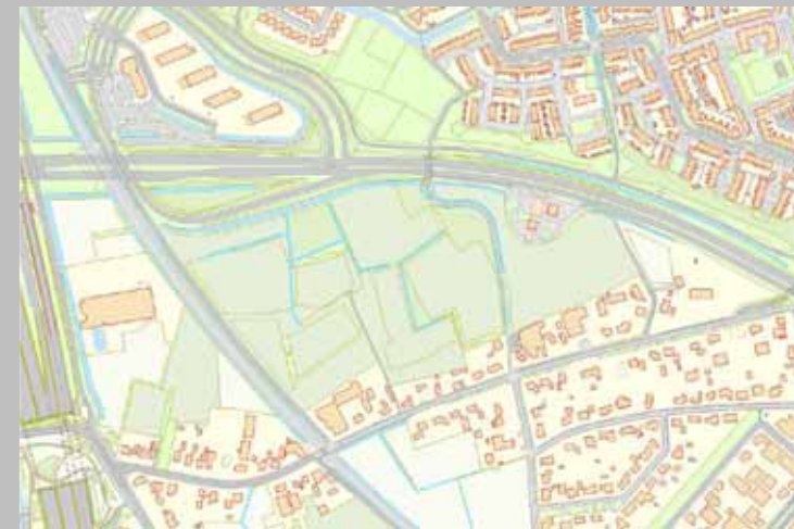
Waterhuishouding, berging en afvoer