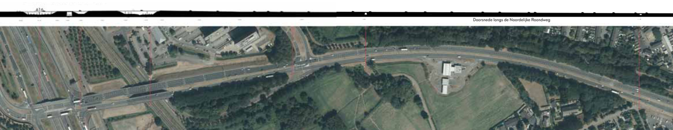
Doorsnede langs de Noordelijke Roondweg