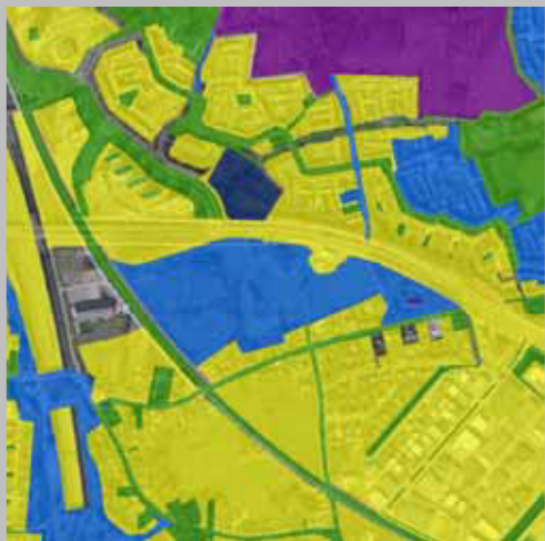
Archeologie en cultuur-historische waarden