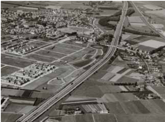
Kom van Prinsenbeek vanuit het zuidoosten. In het midden Rijksweg 16, 1960.