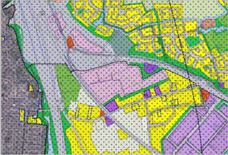
Omgevingsvisie en Bestemmingsplan