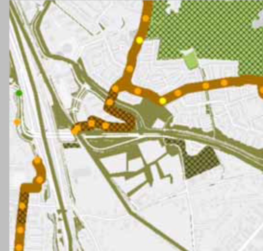
Natuurnetwerk en EVZ ecologische verbingszone