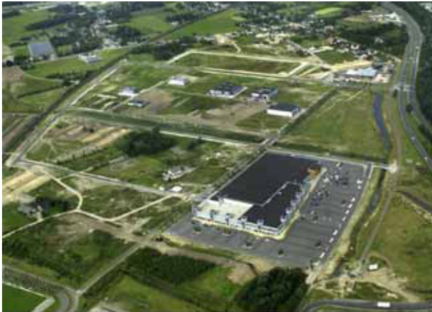
Bouw van de bedrijventerrein in 2001

Kleinschalig agrarisch cultuurlandschap Verbinding Landgoed Burgst Gageldonkseweg historisch relict Laagtes en hoogtes, beekdal-landschap