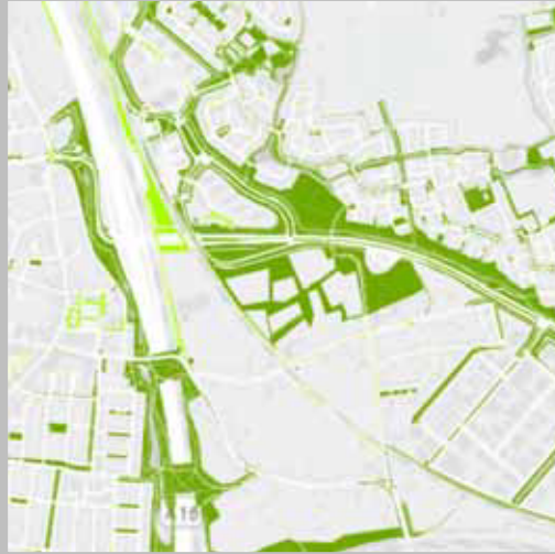
Groenkompas, compensatiebeginsel en kapvergunningen