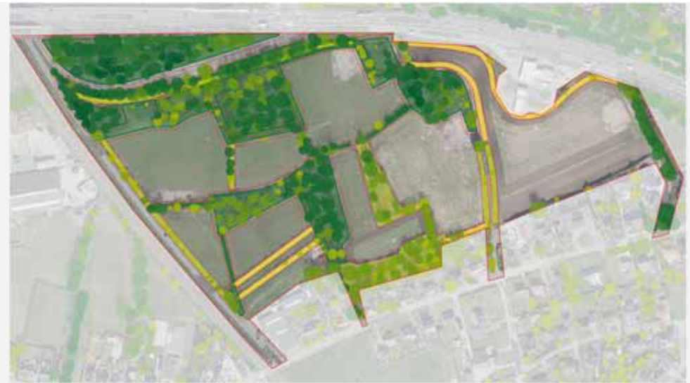
Coulisselandschap met grasland