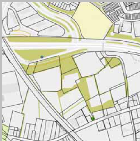
Bodem, luchtkwaliteit, saldering stikstof en energievoorziening